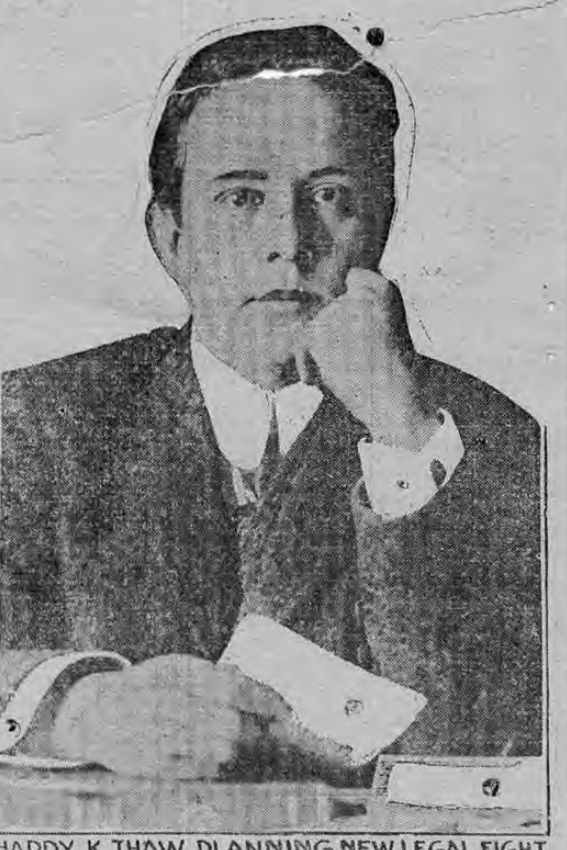
HARRY K. THAW PLANNING NEW LEGAL FIGHT